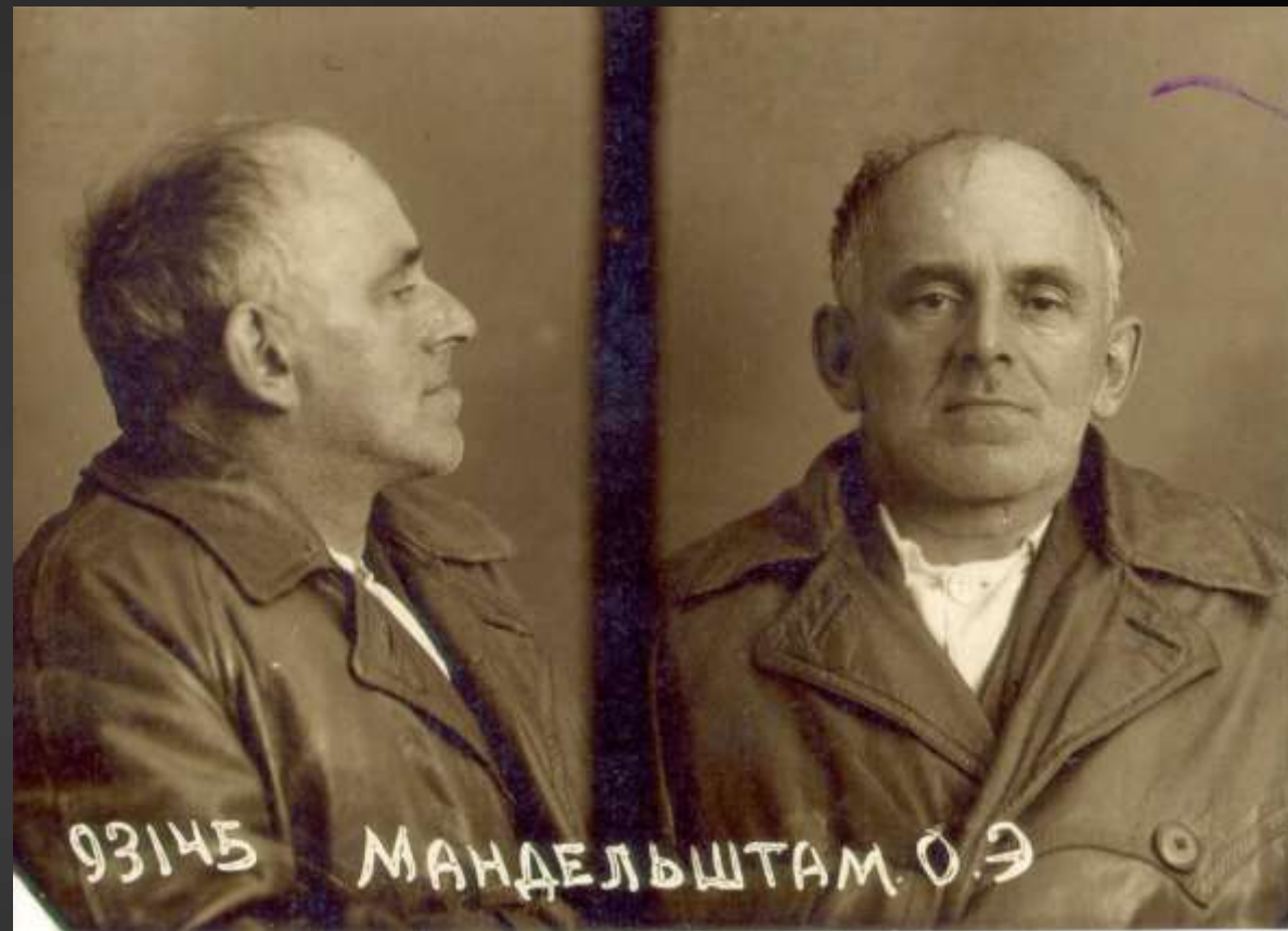
Последняя фотография Осипа Мандельштама

Только защита Бухарина смягчила приговор - выслали в Чердынь-на-Каме, где пробыл две недели, заболел, попал в больницу. Был отправлен в Воронеж, где работал в газетах и журналах, на радио. После окончания срока ссылки возвращается в Москву, но здесь ему жить запрещают. Живет в Калининe. Получив путевку в санаторий, уезжает с женой в Саматиху, где он был вновь арестован. Приговор - 5 лет лагерей за контрреволюционную деятельность. Этапом был отправлен на Дальний Восток. 27 декабря 1938 г. Мандельштам скончался от тифа в пересыльном лагере Владперпункт (Владивосток).